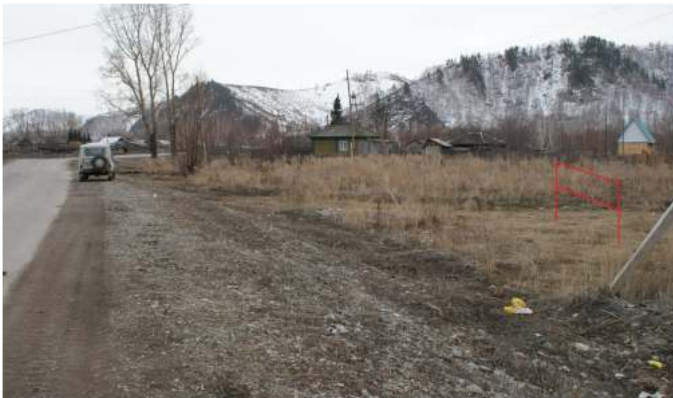
Сторона Б. против хода движения (слева)