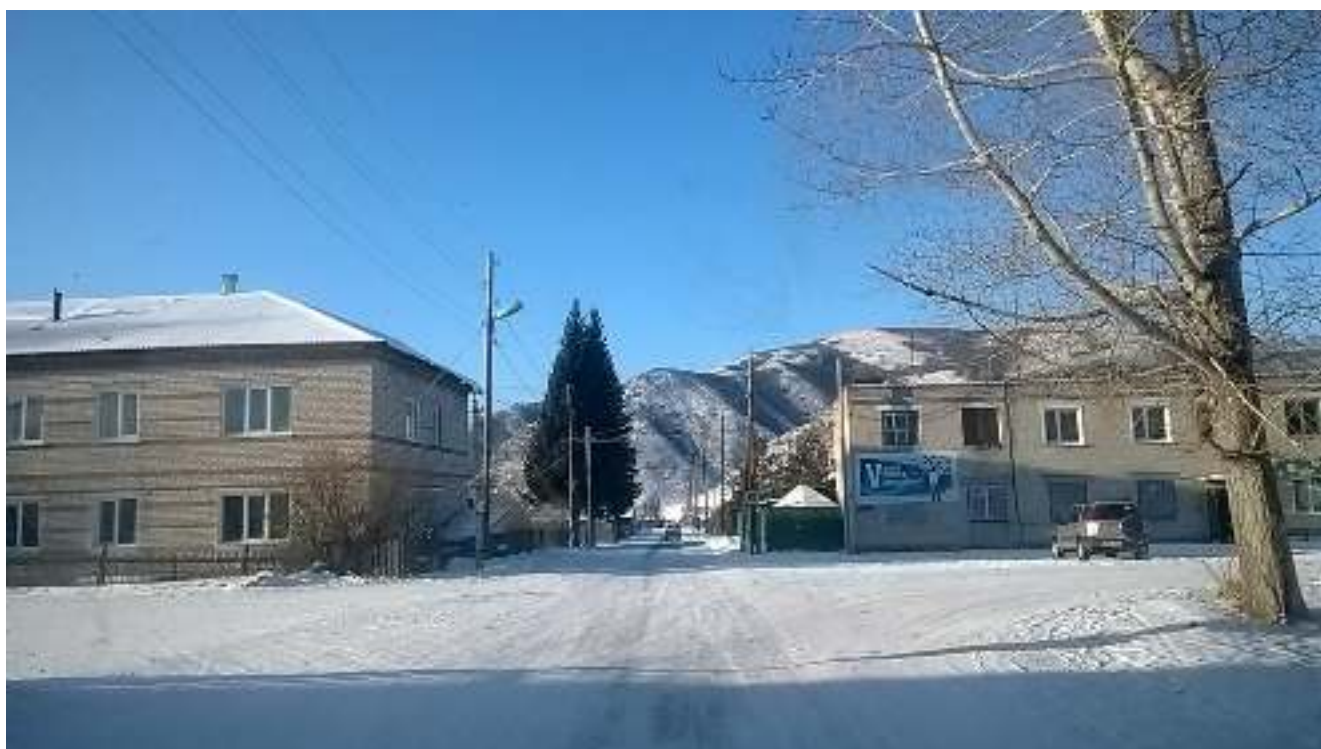
Сторона Б.против хода движения (справа)