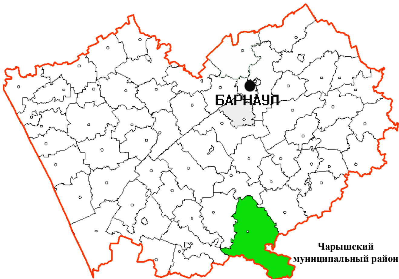
Рис. 1. Географическое положение Чарышского района

Чарышский район Алтайского края территориально расположен в южной части региона. Образован в 1924г. Площадь составляет 6910 км 2 . Районный центр – с. Чарышское – находится в 305 км от Барнаула. Чарышский район граничит: на севере с Усть-Калманским, на северо-востоке с Солонешенским, на западе с Краснощековским, на юго-западе со Змеиногорским районами Алтайского края, на востоке, юго-востоке – с Усть-Канским районом Республики Алтай, на юге – с государством Казахстан.