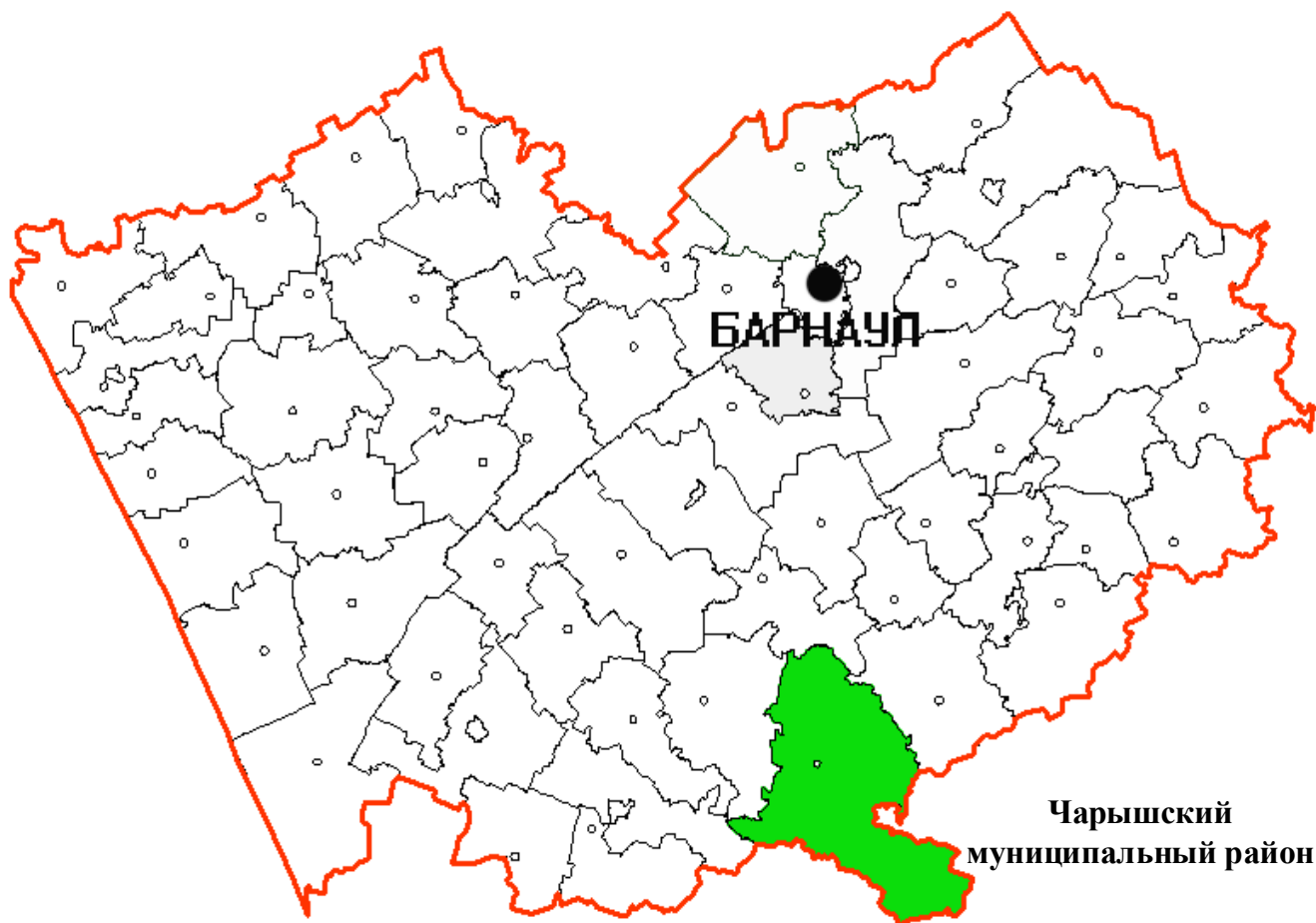
Рис. 1. Географическое положение Чарышского района

Чарышский район Алтайского края территориально расположен в южной части региона. Образован в 1924г. Площадь составляет 6910 км 2 . Районный центр – с. Чарышское – находится в 305 км от Барнаула. Чарышский район граничит: на севере с Усть-Калманским, на северо-востоке с Солонешенским, на западе с Краснощековским, на юго-западе со Змеиногорским районами Алтайского края, на востоке, юго-востоке – с Усть-Канским районом Республики Алтай, на юге – с государством Казахстан.