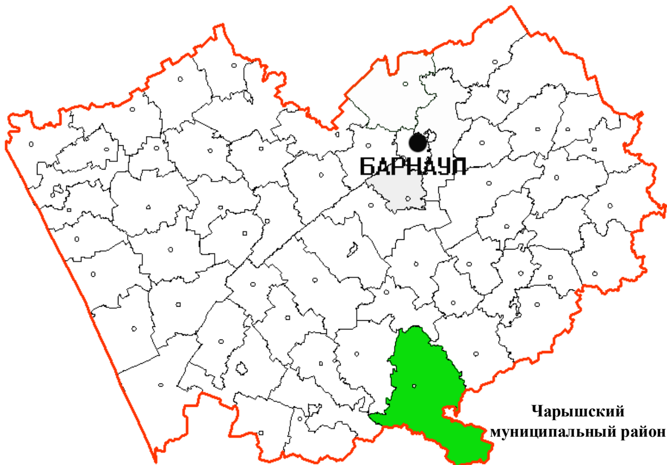
Рис. 1. Географическое положение Чарышского района

Чарышский район Алтайского края территориально расположен в южной части региона. Образован в 1924г. Площадь составляет 6910 км 2 . Районный центр – с. Красный Партизан – находится в 305 км от Барнаула. Чарышский район граничит: на севере с Усть-Калманским, на северо-востоке с Солонешенским, на западе с Краснощековским, на юго-западе со Змеиногорским районами Алтайского края, на востоке, юго-востоке – с Усть-Канским районом Республики Алтай, на юге – с государством Казахстан.